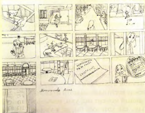
Раскадровки Алии Айтжановой 2-курс