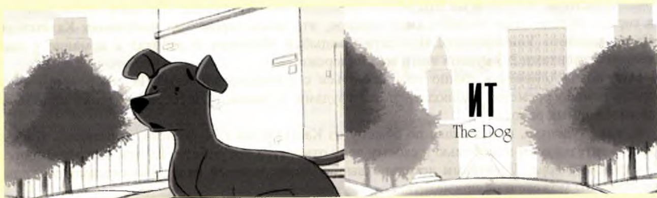
Кадры из короткометражного мультфильма «Ит».