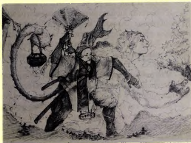
Улугбек Бялов 2-курс